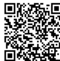
新規ユーザ登録 年間選手登録 QR