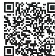
新規ユーザ登録 年間選手登録 QR