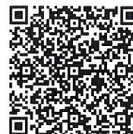
スタートアップガイド QR

https://c2.members-support.jp/karate-jkjo/