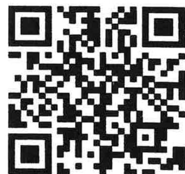
新規登録 QR コード