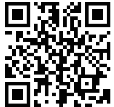
新規登録 QR コード